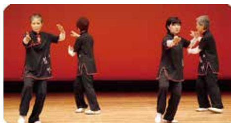
太極拳教室(佐和田体育協会)