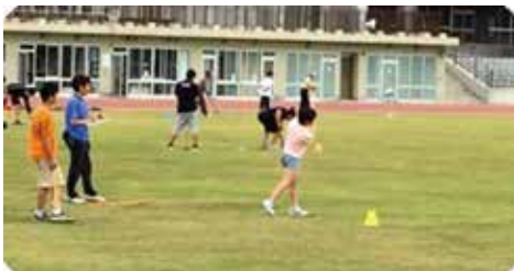
設立記念グラウンド・ゴルフ大会

一つ、佐渡市スポーツ協会は、子どもからお年寄りまで地域住民の健康・体力維持向上に貢献し、生涯スポーツの振興を図ります。