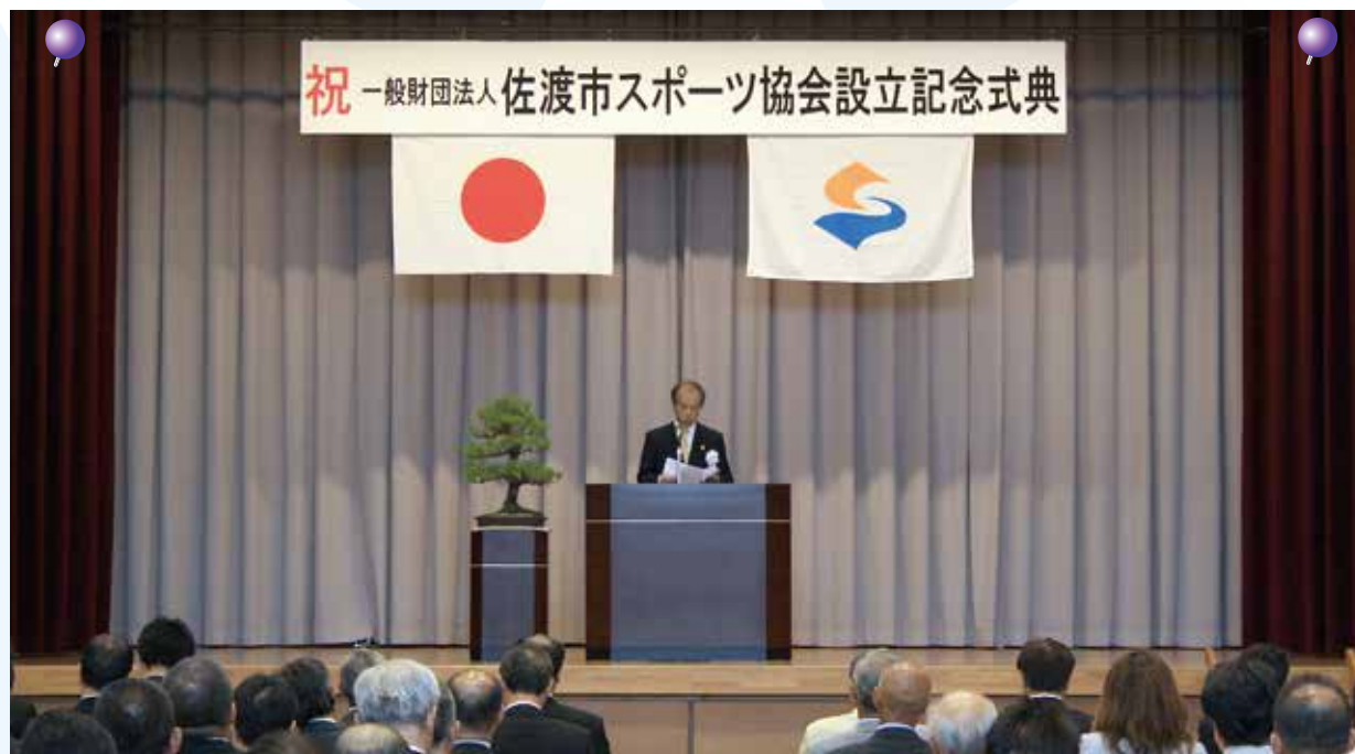
佐渡市スポーツ協会設立記念式典