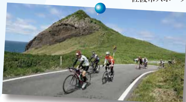
スポニチ佐渡ロングライド210