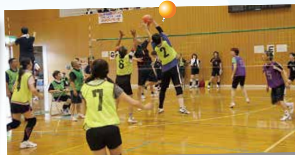
佐渡市総合スポーツ大会