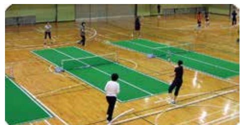
バウンドテニス講習会(真野体育協会)