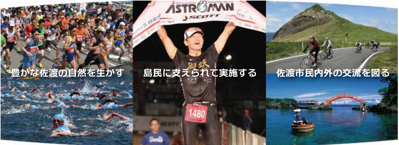
豊かな佐渡の自然を生かす

一つ、佐渡市スポーツ協会は、佐渡の環境を生かしたスポーツ活動が、島内外のアスリートにより親しまれ、スポーツアイランド佐渡として、ますます充実・発展するように努めます。