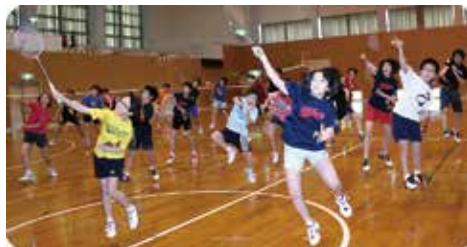
ジュニアバドミントンスクール(佐渡バドミントン協会)