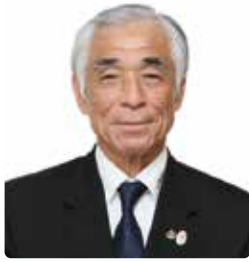
公益財団法人 日本水泳連盟会長 青木 剛 Tsuyoshi Aoki

「2019 佐渡オープンウォータースイミング」が 8 月 4 日、新潟県佐渡市佐和田海水浴場にて開催されることは、誠に喜ばしい限りです。